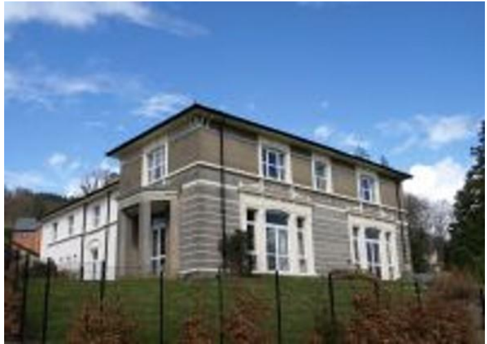
Map a gwybodaeth ychwanegol ar y dudalen nesaf